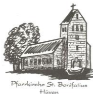
Pfarrkirche St. Bonifatius Hüven