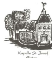
Kapelle St. Josef Eisten